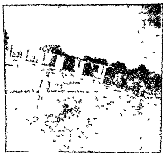
भोपडिया का स्थान पर नये घरों में

कच्चे फूस की भोपडियाँ, क के साथ एक सटी हुई और बीच में छोटी-छोटी गलियाँ । अब इस वस्ती से थोड़ी दूर दो लाइनों में नये घर बनाये जा रहे हैं । घरों की दो लाइनों के बीच चौड़ी सड़क । घरों में प्रकाश व हवा की अच्छी व्यवस्था है । छत्ते फूस की जगह क्वेलुओं की बनेगी ।